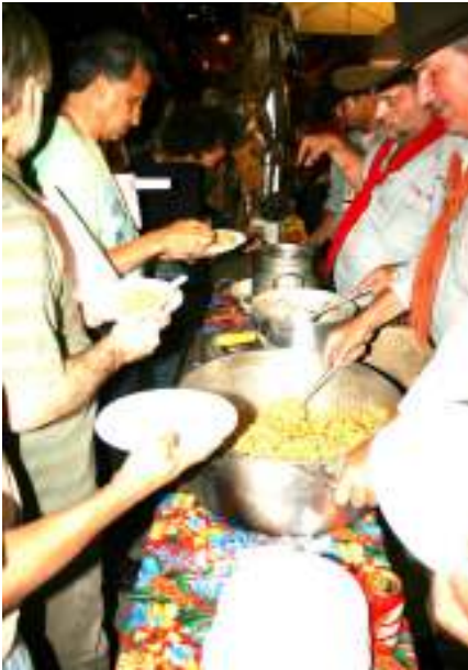
Servindo a Queima do Alho no 1º Encontro da Diversidade, no RJ (2010)