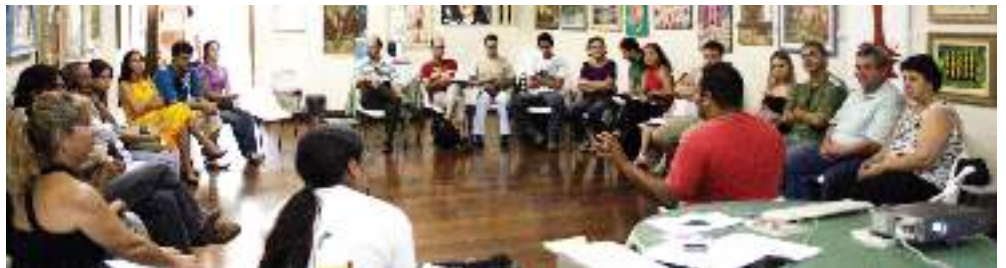
Oficinas como uma das realizadas em Matão (2009): atualização e intercâmbio de ideias e ações