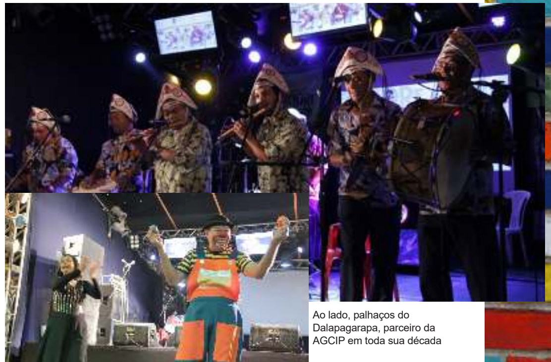
Ao lado, palhaços do Dalapagarapa, parceiro da AGCIP em toda sua década