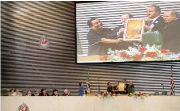
Sessão na Assembleia Legislativa do Estado, com ato em prol da cultura caipira (2009); AGCIP é de utilidade pública estadual