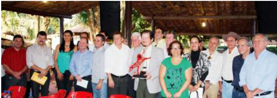
17 prefeitos reunidos com o MinC, em Barretos, assinando convênios do Consórcio Intermunicipal Culturando (2010)

Visite o sítio www.agcip.org.br e conheça mais sobre esta entidade que vem suprimindo com muita dedicação e parcerias lacunas de fomento cultural, esportiva e turística que existe nesse país, em especial no interior do Estado de São Paulo.