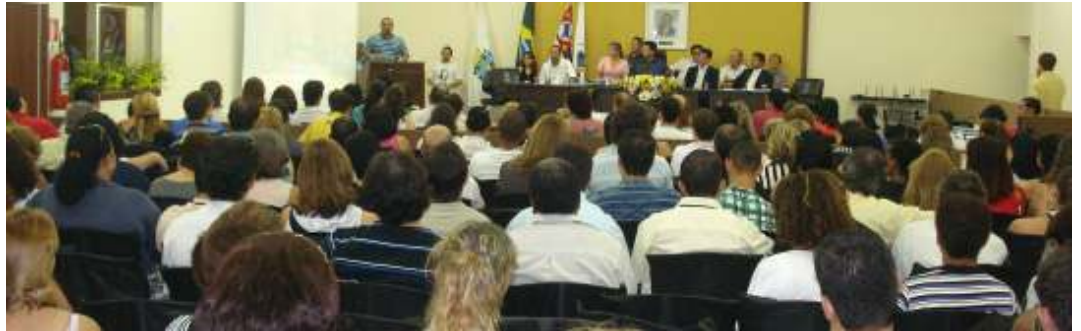
Conferência Intermunicipal de Pontal (2009), com 33 municípios - a maior do País no ano