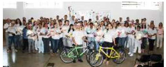
Sessão Solene sobre a Cultura Caipira, na Assembleia Legislativa de SP (2008), promovida em parceria com a AGCIP que, junto ao Consórcio criado, geriu 60 Agentes de Leitura (foto acima) em convênio com o MinC e cidades consorciadas (2010-2011)

Associação Gestão Cultura Interior Paulista "Prof. Gilberto Morgado".