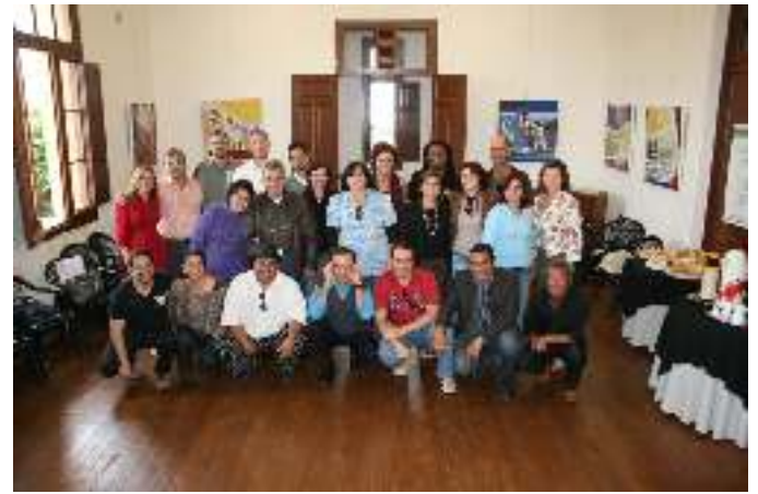
Representantes de dez cidades e, acima de tudo, parceiros de longa data em um dos encontros da AGCIP